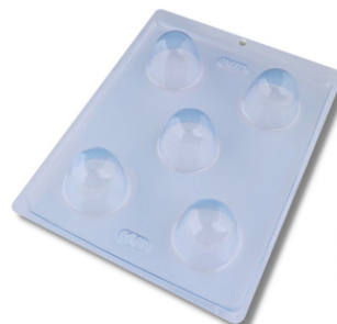
FORMA SIMPLES TRAD. BOMBOM 56 G.