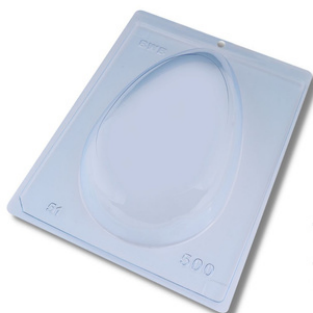
FORMA ESPECIAL OVO LISO 500G.