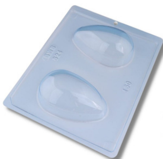
FORMA ESPECIAL OVO LISO 150G.