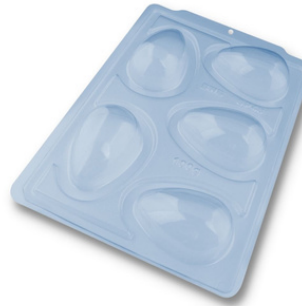
FORMA ESPECIAL OVO LISO 100G.