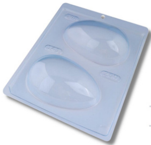
FORMA SIMPLES TRAD. OVO LISO 250 G.