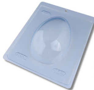
FORMA SIMPLES TRAD. OVO LISO 350 G.