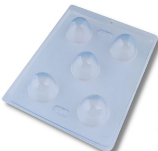
FORMA SIMPLES TRAD. TRUFA 50 G.