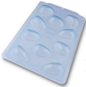
FORMA ESPECIAL OVO LISO 50G.