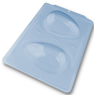
FORMA ESPECIAL OVO LISO 350G.