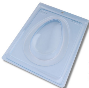
FORMA ESPECIAL OVO LISO 250G.