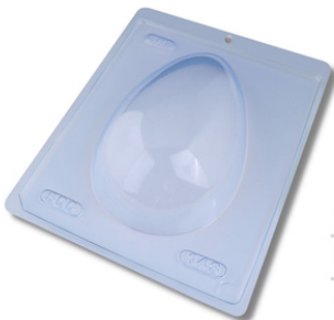
FORMA SIMPLES TRAD. OVO LISO 500 G.