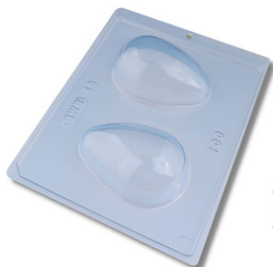
FORMA ESPECIAL OVO LISO 100G.