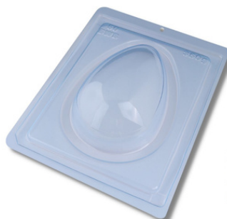
FORMA ESPECIAL OVO LISO 350G.