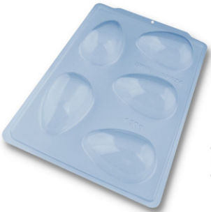
FORMA ESPECIAL OVO LISO 150G.