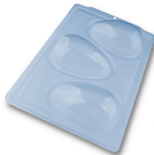
FORMA ESPECIAL OVO LISO 250G.